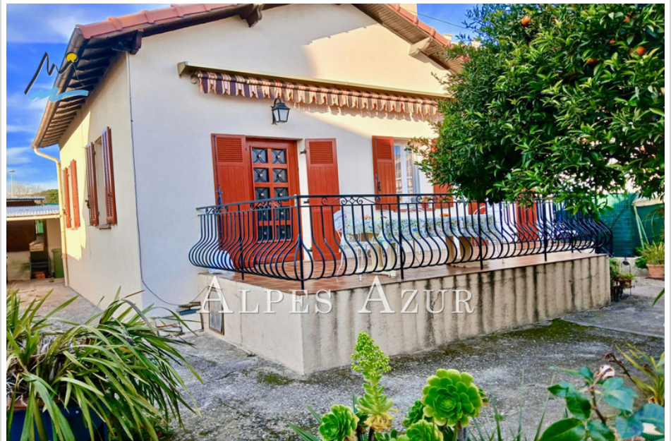
House 12954 Cagnes-sur-Mer

IN A QUIET LOCATION in the popular and sought-after area of PINEDE in CAGNES sur MER, close to the beaches and shops, our agency offers this single-storey house for sale